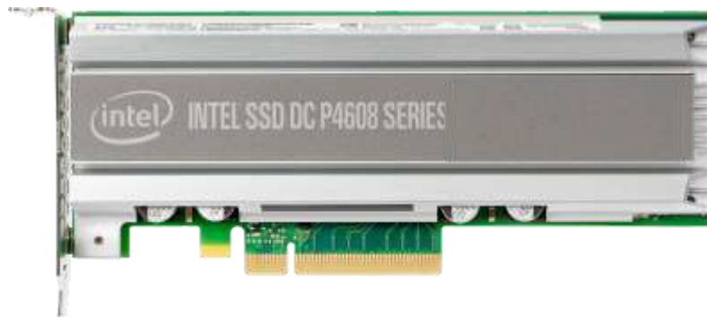
图 2: Flash Accelerator PCIe 卡

其性能比传统存储阵列架构高数个数量级，也远非当今的全闪存存储阵列可比。值得注意的是，这些数据是在单机架 Exadata 系统中以标准 8K 数据库 I/O 规模运行 SQL 负载时测定的真实的端到端性能结果，存储供应商给出的性能评价则通常基于较小的 I/O 规模和低级 IO 工具，因此比 SQL 所实现的性能高出许多倍。